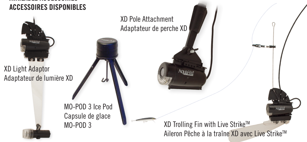
XD Light Adaptor Adaptateur de lumière XD